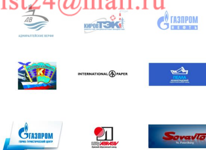
Рисунок 4 - Клиенты ООО ПК «ВентКомплекс»

Клиенты ООО ПК «ВентКомплекс» приведены на рисунке 4.